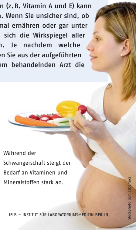
Während der Schwangerschaft steigt der Bedarf an Vitaminen und Mineralstoffen stark an.